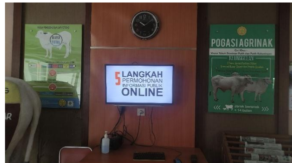
Ruang Pelayanan Informasi

Sarana penunjang bagi pelayanan PPID di Loka Pengujian Standar Instrumen Ruminansia Besar telah dipersiapkan dan dilakukan upgrade secara berkala, dan sampai saat ini operasional dilakukan oleh satu petugas layanan PPID, dan secara struktural masih di bawah bagian Layanan Humas.